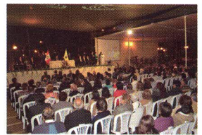
75 Aniversario del Distrito