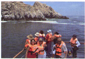
Paseos del Programa Municipal del Adulto Mayor