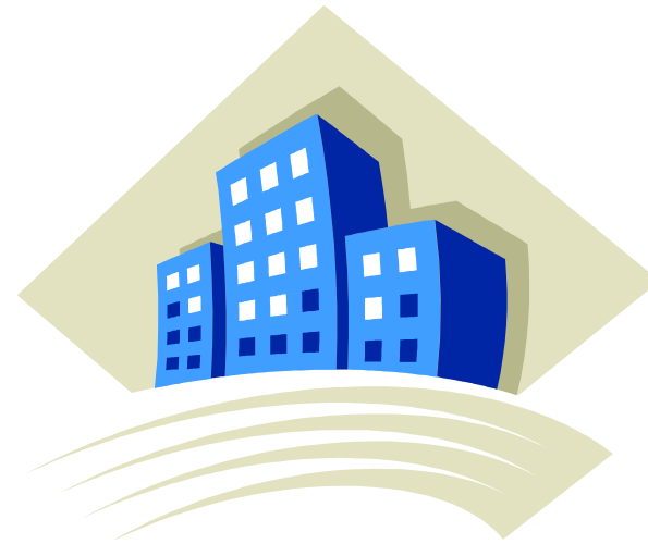
Imagen de ciudad que anhelamos.