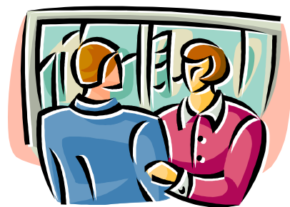
Vecinos comprometidos con el distrito.