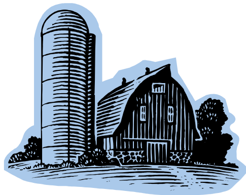
Territorio y Medio Ambiente.