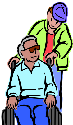
Condiciones de vida de la población.